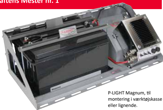
P-LIGHT Magnum, til montering i værktøjskasse eller lignende.