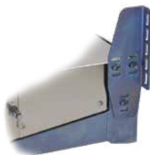
Til P-LIGHT Magnum Frame findes der flere forskellige chassisbeslag

P-LIGHT Magnum anbefales af de fleste liftproducenter.