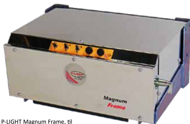
P-LIGHT Magnum Frame, til montering direkte på chassis.