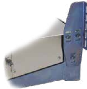
P-LIGHT Magnum Frameen on saatavana erilaisia runkokiinnikkeitä.

Useimmat nostinvalmistajat suosittelevat P-LIGHT Magnumia.