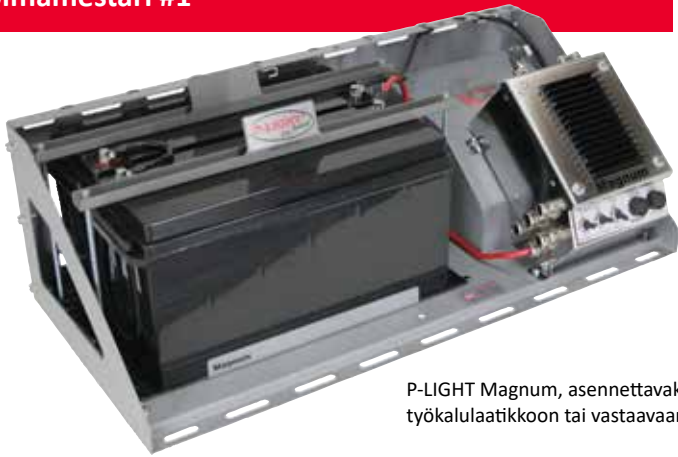
P-LIGHT Magnum, asennettavaksi työkalulaatikkoon tai vastaavaan.