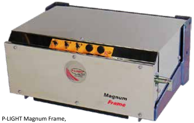
P-LIGHT Magnum Frame, asennettavaksi suoraan runkoon.