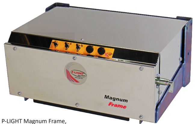
P-LIGHT Magnum Frame, asennettavaksi suoraan runkoon.