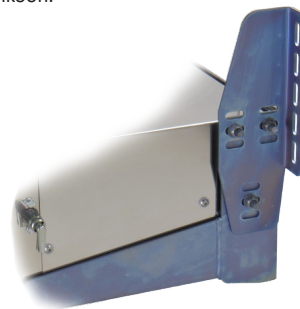
P-LIGHT Magnum Frameen on saatavana erilaisia runkokiinnikkeitä.

Useimmat nostinvalmistajat suosittelevat P-LIGHT Magnumia.