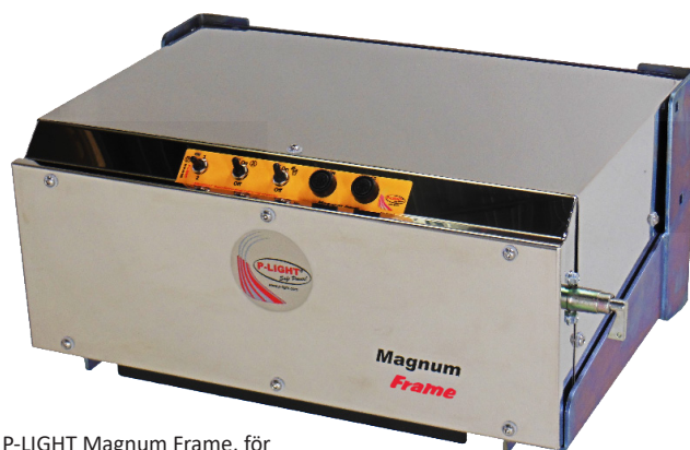
P-LIGHT Magnum Frame, för montering direkt på ramen.