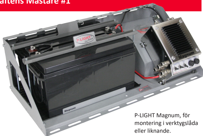
P-LIGHT Magnum, för montering i verktygslåda eller liknande.